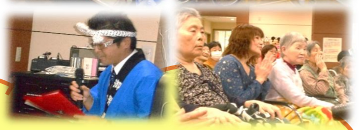
菊地会様慰問による『三味線民謡』